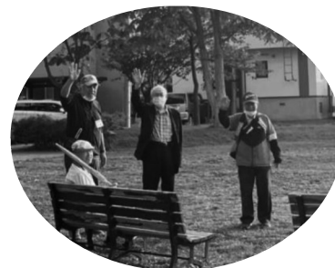
「見つけたよー！」 優しい声かけもバッチリ☆