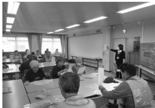
話し方のポイントについてのおさらいです

認知症の症状や気持ちについての話を聞いていただき、実際に徘徊している認知症高齢者に話しかけるポイントを抑えていただいた上で、徘徊模擬訓練を行いました。