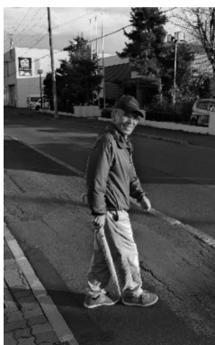
颯爽と到着！ 健脚の秘密は「ゴルフ」

認知症の高齢者に対する初の法律「共生社会の実現を推進するための認知症基本法」が2024年1月に施行されました。