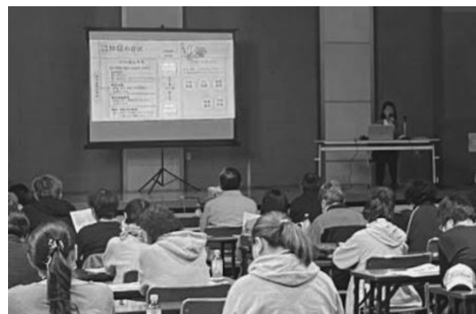
熱心に講話に聞き入る参加者の皆様

認知症の症状とはどのようなものか、なぜ徘徊するのか（子どもの頃に住んでいた家に帰りたい、など）、 認知症・認知症の疑いでの行方不明が過去最多（2023年で1万9039人） となっていること、今後も少子高齢化が進み認知症の方が増えていくことが予測されるなど、札幌市や伏古本町地区の統計や相談をもとに、包括職員から説明させていただきました。